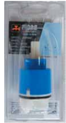
35 BLI 026 Cartuccia universale diam. 35 con distributore Universal cartridge with distributor diameter 35 ΓΕΝΙΚΗΣ ΧΡΗΣΗΣ ΑΝΑΜ. ΜΗΧΑΝΙΣΜΟΣ ΚΕΡΑΜΙΚΩΝ ΔΙΣΚΩΝ 35mm ΜΕ ΒΑΣΗ