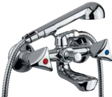
24 F210 SG Gruppo vasca esterno con doccia cromata External bath mixer with chrome shower ΜΠΑΤΑΡΙΑ ΛΟΥΤΡΟΥ ΜΕ ΣΠΙΡΑΛ 1,5 M + ΧΡΩΜΕ ΝΤΟΥΖΑΚΙ