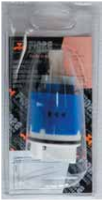
35 BLI 022 Cartuccia ECO-STOP diam. 35 con distributore ECO-STOP cartridge with distributor diameter 35 ECO-STOP ΑΝΑΜΙΚΤΙΚΟΣ ΜΗΧΑΝΙΣΜΟΣ ΚΕΡΑΜΙΚΩΝ ΔΙΣΚΩΝ 35mm ΜΕ ΒΑΣΗ