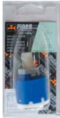
35 BLI 0023 Cartuccia ECO-STOP diam.35 senza distributore ECO-STOP cartridge without distributor diameter 35 ECO-STOP ΑΝΑΜΙΚΤΙΚΟΣ ΜΗΧΑΝΙΣΜΟΣ ΚΕΡΑΜΙΚΩΝ ΔΙΣΚΩΝ 35mm ΧΩΡΙΣ ΒΑΣΗ