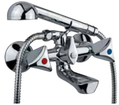
24 F210 GR Gruppo vasca esterno con doccia cromata External bath mixer with chrome shower ΜΠΑΤΑΡΙΑ ΛΟΥΤΡΟΥ ΜΕ ΣΠΙΡΑΛ 1,5 M + ΧΡΩΜΕ ΝΤΟΥΖΑΚΙ