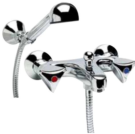
24 0201 DC Gruppo vasca piatto con doccia cromata Flat bath mixer with chrome shower ΜΠΑΤΑΡΙΑ ΛΟΥΤΡΟΥ ΕΠΙΠΕΔΗ ΜΕ ΣΠΙΡΑΛ 1,5 M + ΧΡΩΜΕ ΝΤΟΥΖΑΚΙ 24 0199 00 Gruppo vasca piatto senza duplex Flat bath mixer without shower set ΜΠΑΤΑΡΙΑ ΛΟΥΤΡΟΥ