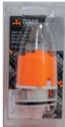
35 BLI 032 Cartuccia diam. 42 ECO-STOP ECO-STOP cartridge diameter 42 ECO-STOP ΑΝΑΜΙΚΤΙΚΟΣ ΜΗΧΑΝΙΣΜΟΣ ΚΕΡΑΜΙΚΩΝ ΔΙΣΚΩΝ 42mm