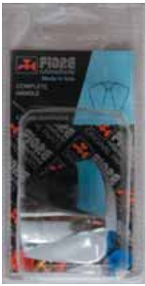
35 BLI 001 Maniglia completa Complete handle ΛΑΒΗ ΠΛΗΡΗΣ CLASSIC LINE