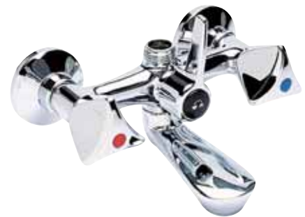
24 0202 DG Gruppo vasca senza doccia a colonna Bath tube set without shower ΜΠΑΤΑΡΙΑ ΛΟΥΤΡΟΥ 24 0202 GR Gruppo vasca senza doccia a colonna Bath tube set without shower ΜΠΑΤΑΡΙΑ ΛΟΥΤΡΟΥ ΚΟΡΜΟΣ ΧΩΡΙΣ ΔΙΧΑΛΟ