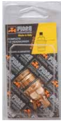
35 BLI 002 Vitone rapido 1/2" Complete 1/2" headworker ΤΑΧΥΜΗΧΑΝΙΣΜΟΣ ΟΡΕΙΧΑΛΚΙΝΟΣ ΜΙΑΣ ΣΤΡΟΦΗΣ 1/2"