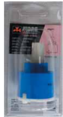
35 BLI 036 Cartuccia universale diam. 40 con distri- butore Universal cartridge with distributor diameter 40 ΓΕΝΙΚΗΣ ΧΡΗΣΗΣ ΑΝΑΜ. ΜΗΧΑΝΙΣΜΟΣ ΚΕΡΑΜΙΚΩΝ ΔΙΣΚΩΝ 40mm ΜΕ ΒΑΣΗ