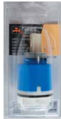
35 BLI 035 Cartuccia universale diam. 40 senza distributore Universal cartridge without distributor diameter 40 ΓΕΝΙΚΗΣ ΧΡΗΣΗΣ ΑΝΑΜ. ΜΗΧΑΝΙΣΜΟΣ ΚΕΡΑΜΙΚΩΝ ΔΙΣΚΩΝ 40mm ΧΩΡΙΣ ΒΑΣΗ