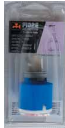
35 BLI 025 Cartuccia universale diam.35 senza distributore Universal cartridge without distributor diameter 35 ΓΕΝΙΚΗΣ ΧΡΗΣΗΣ ΑΝΑΜ. ΜΗΧΑΝΙΣΜΟΣ ΚΕΡΑΜΙΚΩΝ ΔΙΣΚΩΝ 35mm ΧΩΡΙΣ ΒΑΣΗ