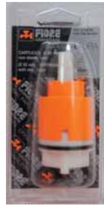
35 BLI 020 Cartuccia diam. 35 con distributore Cartridge with distributor diameter 35 ΑΝΑΜΙΚΤΙΚΟΣ ΜΗΧΑΝΙΣΜΟΣ ΚΕΡΑΜΙΚΩΝ ΔΙΣΚΩΝ 35mm ΜΕ ΒΑΣΗ