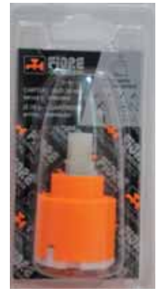
35 BLI 021 Cartuccia diam. 35 senza distributore Cartridge without distributor diameter 35 ΑΝΑΜΙΚΤΙΚΟΣ ΜΗΧΑΝΙΣΜΟΣ ΚΕΡΑΜΙΚΩΝ ΔΙΣΚΩΝ 35mm ΧΩΡΙΣ ΒΑΣΗ