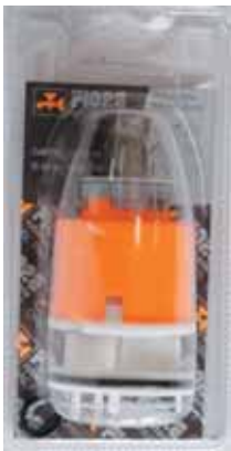
35 BLI 030 Cartuccia diam. 42 Cartridge diameter 42 ΑΝΑΜΙΚΤΙΚΟΣ ΜΗΧΑΝΙΣΜΟΣ ΚΕΡΑΜΙΚΩΝ ΔΙΣΚΩΝ 42mm